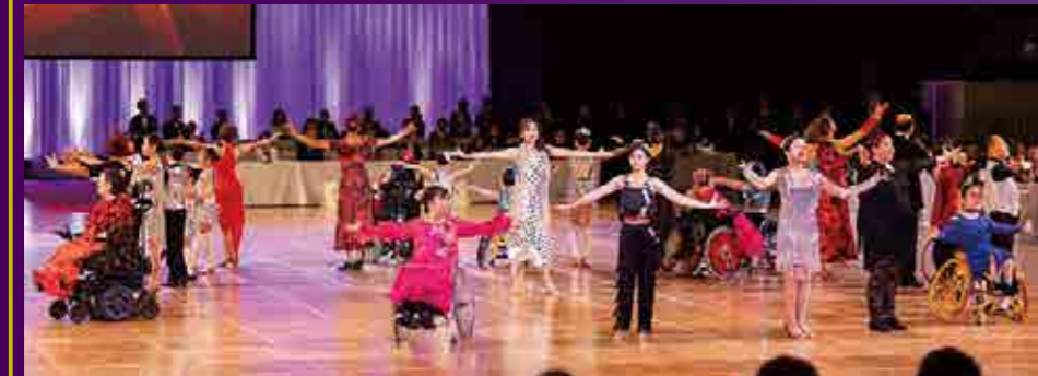
感動の車いすダンスエキシビジョン