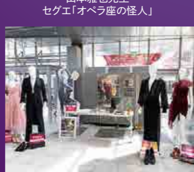
大好評だった映画「10DANCE」ブース