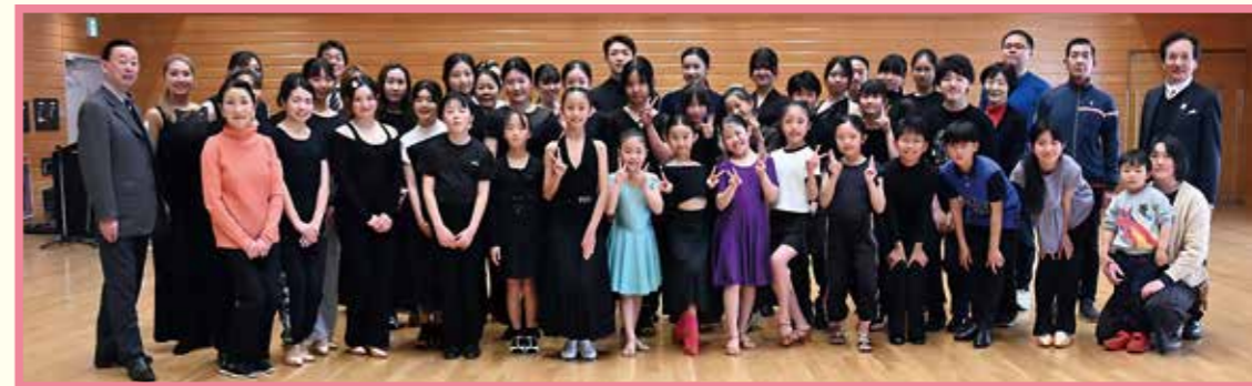
参加者揃って記念撮影

なお、来年からはジュニア競技選手、ジュブナイル競技選手の育成・強化に向けた新たな取組を行う予定です。