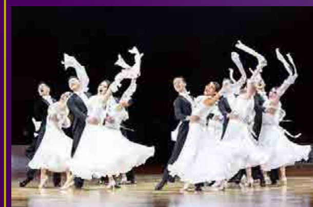
セレモニーを彩った電通大ダンス部