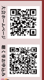
大会ホームページ 観く券お申込み